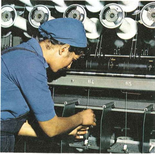
İşçi sağlığı ve iş güvenliği (kulaklık)

Üretim ünitelerimizde 1977 yılında öngörülen kalite, miktar ve verimlilik hedeflerine ulaşılmış ve müşteri spesifikasyonlarına uygun 5356 ton ham bez, 5147 ton mamul bez üretimi gerçekleştirilmiştir. Mamulümüz, geçen dönem başlattığımız ihracat çalışmaları neticesinde ihracat faaliyetlerimizi tevcih ettiğimiz komşu ülkelerdeki lastik fabrikalarının kalite onayından geçmiş, uluslararası standart ve kalite normlarına uygunluğu tescil edilmiştir.