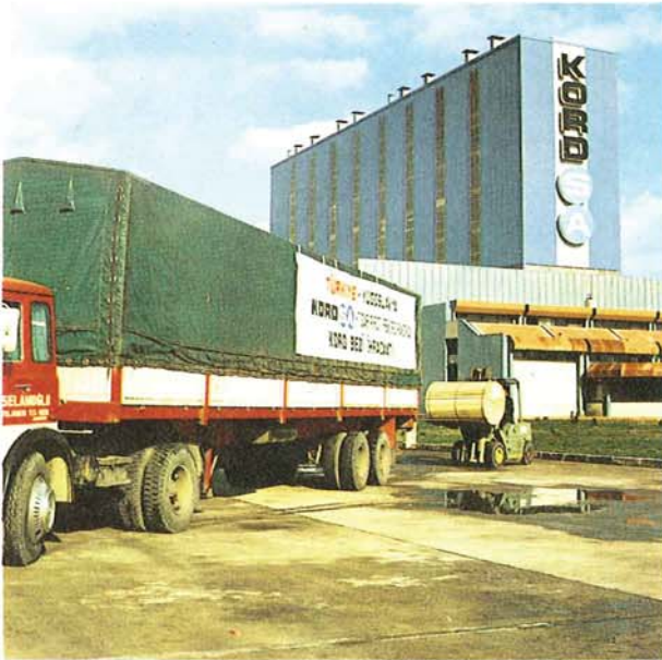
Yugoslavya'ya ihraç edilen ihracat rulosunun yüklenmesi anından bir görünüş

1977 senesinde nylon, rayon ve polyester olarak ürettiğimiz muhtelif tiplerden toplam 4852 ton satış gerçekleşmiştir. Bu miktarın 4420 tonu 4 lastik fabrikasına, 112 tonluk miktarı bisiklet, motorsiklet lastiği imalatçılara, 214 tonu da konveyör, transmisyon kayışı ve hortum imalatçılara olmak üzere 4746 tonu iç piyasaya satılmış, 106 tonu ise dış piyasalara ihraç edilmiştir.