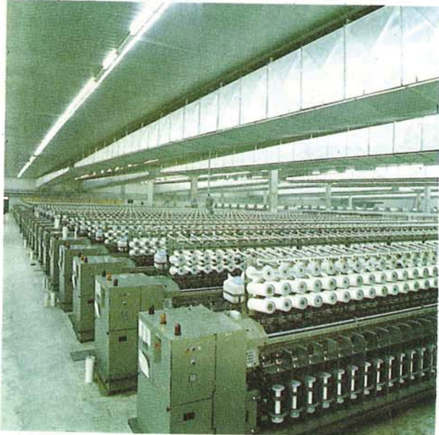
Büküm makinalarının genel görünüşü

Gelişen Türk lastik sanayinin ihtiyaçlarını, yaratılan ihracat imkanlarını karşılayabilmek için büküm-dokuma kapasitesini 14800 ton/yıla çıkarmak üzere hazırlanan tevsi projemiz için Teşvik Belgesi alınmıştır. Teknik çalışmaların tamamlanmak üzere olduğu bu projemizin inşaatına Mayıs ayı içinde başlanması planlanmaktadır.